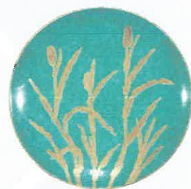
二代徳田八十吉 豊秋飾皿