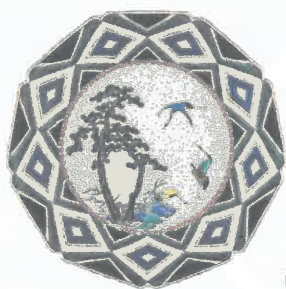
初代徳田八十吉 古九谷欽慕松鶴図九角皿