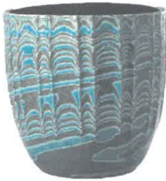
二代徳田八十吉 深厚罐彩線文壺